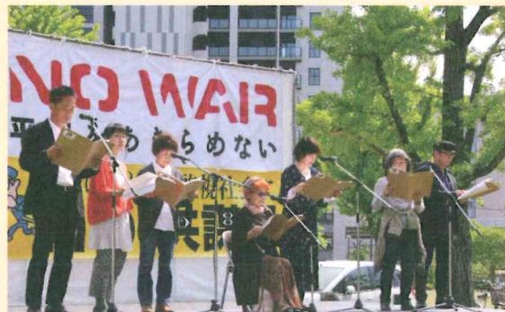
憲法を語り合うピースリーディング